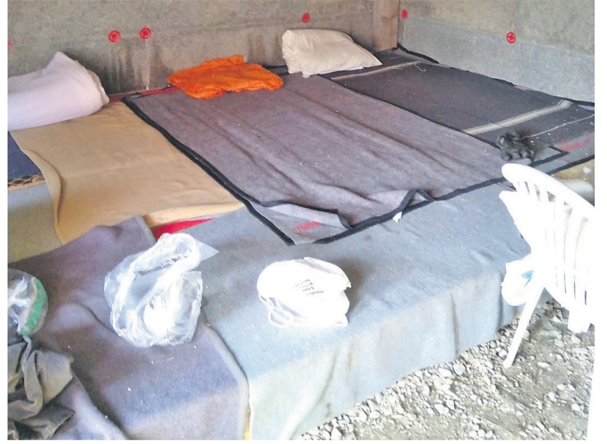
In Ključ schlafen die Flüchtlinge auf Betten, die sie sich aufgebaut haben.