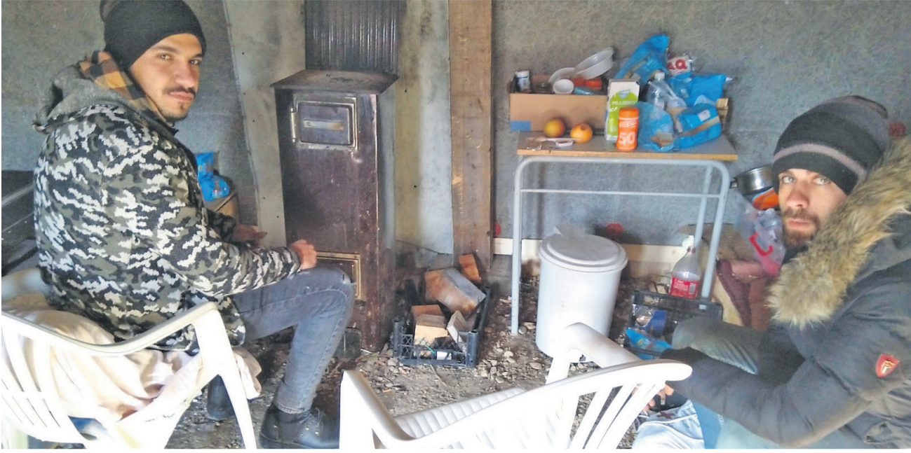
Diese beiden Geflüchteten leben in einem Camp in Ključ, im Nordwesten von Bosnien und Herzegowina.