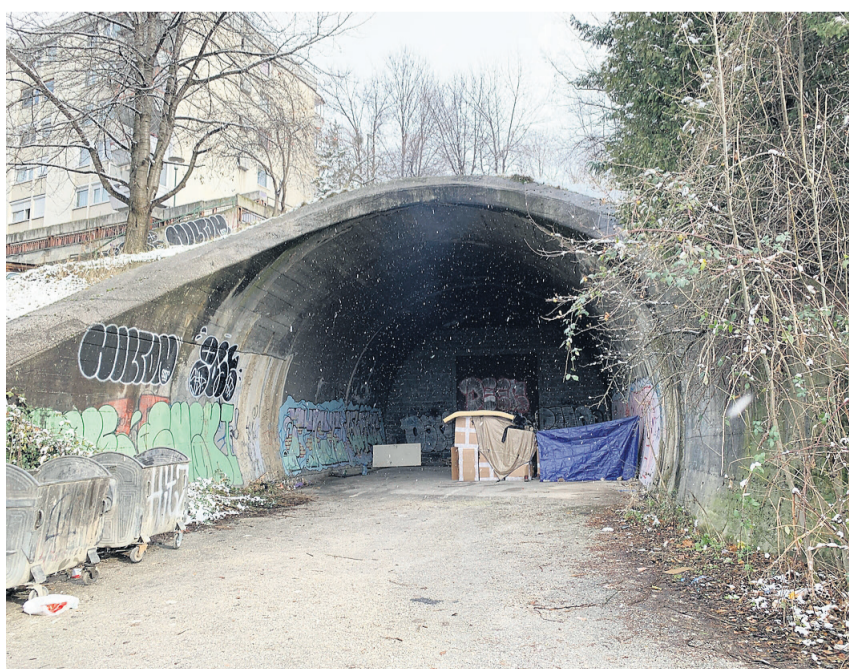
Ein kleines Camp irgendwo draussen in Bosnien und Herzegowina.